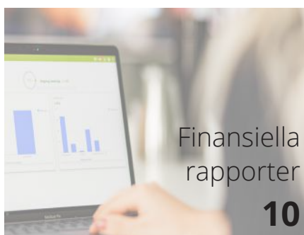
Finansiella rapporter 10